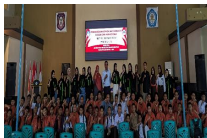
Gambar 5. Foto Bersama Siswa Siswi SMK Negeri 3 Gorontalo

tanggung jawab, serta kejujuran dalam membentuk pribadi yang unggul.