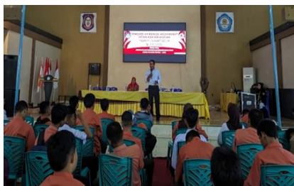
Gambar 4. Dialog Bersama Siswa Siswi Terkait Pendidikan Karakter

Materi diberikan melalui pendekatan yang interaktif, termasuk penggunaan studi kasus, tanya jawab, dan refleksi pengalaman siswa. Hal ini mendorong keterlibatan aktif dari peserta didik, baik secara kognitif maupun afektif. Suasana diskusi berlangsung dinamis; sebagian besar siswa menunjukkan antusiasme tinggi dengan mengajukan pertanyaan serta mengaitkan materi dengan pengalaman pribadi mereka. Meskipun demikian, masih ditemukan sebagian kecil siswa yang membutuhkan bimbingan lebih lanjut untuk benar-benar memahami makna dan penerapan nilai-nilai tersebut dalam kehidupan sehari-hari.