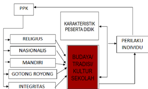
Gambar 2. Lima nilai utama karakter bangsa

didik melalui integrasi olah hati, olah rasa, olah pikir, dan olah raga. Gerakan ini melibatkan kerjasama antara satuan pendidikan, keluarga, dan masyarakat sebagai bagian dari Gerakan Nasional Revolusi Mental (GNRM). PPK mengedepankan lima nilai karakter utama yang bersumber dari Pancasila, yaitu religius, nasionalisme, integritas, kemandirian, dan gotong royong.