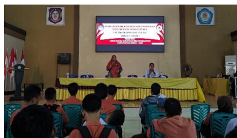
Gambar 3. Sesi Pemaparan Materi Penguatan Karakter

Namun, meskipun sebagian besar siswa dapat mengikuti dengan baik, ada beberapa yang masih kesulitan untuk memahami sepenuhnya konsep-konsep yang diajarkan, terutama terkait penerapannya dalam situasi sehari-hari. Hal ini terlihat dari beberapa siswa yang membutuhkan penjelasan tambahan atau contoh yang lebih konkret untuk dapat mengaitkan nilai-nilai tersebut dengan pengalaman pribadi mereka. Meskipun demikian, antusiasme mereka untuk belajar dan berpartisipasi tetap tinggi, yang menunjukkan bahwa mereka mulai terbuka untuk memahami dan menginternalisasi nilai-nilai karakter yang diberikan.