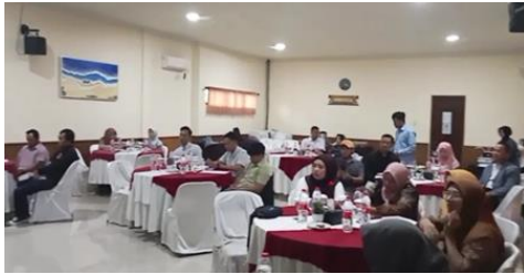
Gambar 6. Interaksi antara Pemateri dan Peserta Workshop

menekankan pada transparansi laporan keuangan, pembukuan yang teliti, audit rutin, dan penerapan standar pelaporan keuangan yang konsisten.