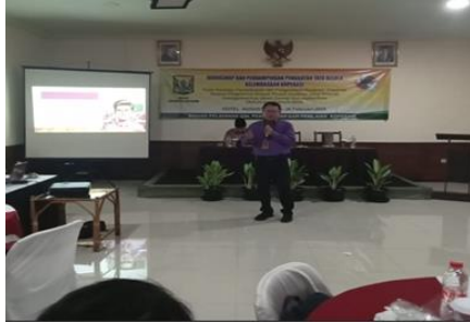
Gambar 1. Penyampaian Materi dalam Workshop dan Pendampingan

Manajemen Simpanan dan Pinjaman dalam koperasi, penataan kelembagaan koperasi, tentang status hukum kelembagaan koperasi, dengan tujuan meningkatkan akuntabilitas, transparansi, partisipasi, dan profesionalisme dalam tata kelola koperasi.