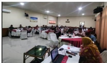
Gambar 2. Diskusi dalam Workshop dan Pendampingan

Pendekatan ini mengintegrasikan teori manajemen koperasi dengan kebutuhan praktis di lapangan, melalui metode kolaboratif yang melibatkan pengurus koperasi secara langsung dalam proses peningkatan kualitas kelembagaan dan operasional koperasi, yang disesuaikan dengan regulasi serta tantangan spesifik di daerah. Pendekatan ini berpotensi menjadi model replikasi bagi penguatan koperasi di wilayah lain.