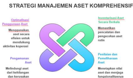
Gambar 8. Strategi Manajemen Aset Komprehensif

Terakhir, disampaikan strategi manajemen aset komprehensif yang mencakup optimalisasi penggunaan, inventarisasi berkala, pengamanan, serta penilaian dan pemeliharaan aset untuk menjaga keberlanjutan operasional koperasi.