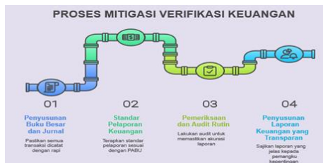
Gambar 7. Proses Mitigasi Verifikasi Keuangan

Peserta juga diajak memahami proses mitigasi verifikasi keuangan melalui pencatatan transaksi yang rapi, penerapan standar pelaporan, audit berkala, dan penyusunan laporan yang transparan.