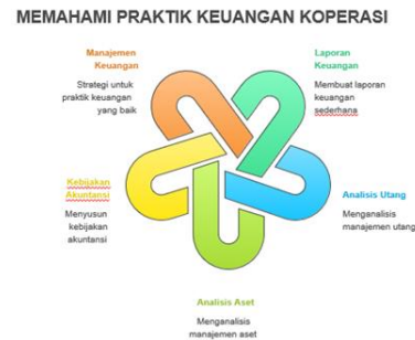
Gambar 9. Memahami Praktek Keuangan Koperasi

Dalam akhir kegiatan ini peserta diberikan simulasi dan pelatihan tentang: