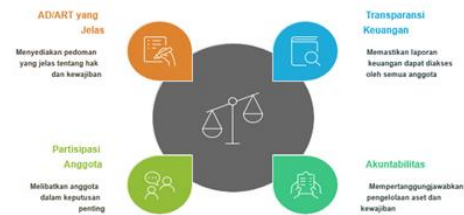
Gambar 3. Elemen Tata Kelola Koperasi Yang Efektif

Selain itu, diskusi juga mencakup pilar-pilar tata kelola koperasi yang baik, yang meliputi: