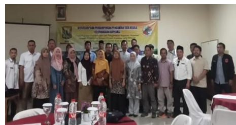
Gambar 10. Foto Bersama Setelah Kegiatan Workshop dan Pendampingan

validasi masalah riil di lapangan dan pendampingan solusi yang relevan. Sehingga keunikan dari kegiatan PKM ini terletak pada pendekatan integratif dan aplikatif yang menggabungkan aspek kelembagaan, keuangan, serta manajerial koperasi secara utuh. Tidak hanya menyampaikan teori tata kelola, kegiatan ini secara langsung membekali pengurus dengan alat praktis dan langkah-langkah strategis, seperti model mitigasi verifikasi keuangan, strategi manajemen aset koperasi, dan panduan kerangka akuntansi koperasi yang jarang disentuh dalam pelatihan koperasi konvensional. Hal ini memberikan dampak konkret pada peningkatan kapasitas koperasi mitra, bukan hanya dari sisi administratif, tetapi juga pada pembentukan budaya tata kelola yang sehat.