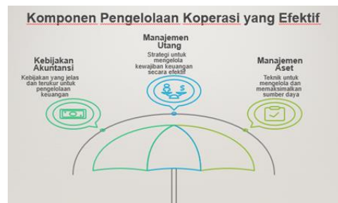
Gambar 5. Komponen Pengelolaan Koperasi yang Efektif

Selain itu juga, dalam diskusi ini juga dibahas tentang komponen pengelolaan koperasi yang efektif, yang meliputi: