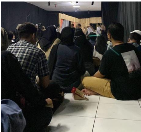
Gambar 1. Sesi ice breaking diikuti para peserta

Materi utama dalam kegiatan ini mengupas isu semakin maraknya pinjaman online (pinjol) di kalangan generasi muda, termasuk berbagai kasus dampak negatif seperti intimidasi, penyebaran data pribadi, hingga bunuh diri akibat tekanan utang. Disampaikan pula bahwa pinjol terbagi menjadi dua jenis, yakni yang terdaftar dan berizin resmi oleh OJK (Otoritas Jasa Keuangan) serta yang ilegal dan tidak diawasi secara hukum. Hartini et al (2025) berpendapat bahwa OJK sebagai lembaga yang berwenang dalam pengawasan dan pengaturan sektor jasa keuangan, termasuk bank syariah, dengan pendekatan prudensial dan perlindungan konsumen Pengetahuan ini diberikan agar mahasiswa dapat membedakan dan memahami risiko dari masing-masing jenis pinjol.