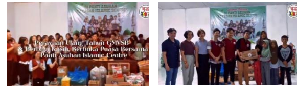
Gambar 5. Perayaan Ulang Tahun GMVSB & Berbagi Kasih, Berbuka Puasa Bersama Panti Asuhan Islamic Centre

Setelah pelaksanaan program, terjadi peningkatan interaksi positif antaranggota komunitas lintas agama yang cukup signifikan. Hal ini tercermin dari berbagai inisiatif yang muncul secara organik di tengah masyarakat. Salah satu dampak nyata adalah lahirnya kegiatan gotong-royong lintas agama yang dilaksanakan secara sukarela oleh warga, menunjukkan tumbuhnya semangat kolaboratif tanpa memandang perbedaan keyakinan (Gambar 5). Selain itu, muncul pula kesepakatan informal di antara tokoh-tokoh agama setempat untuk membentuk forum komunikasi lintas agama di tingkat lokal. Forum ini diharapkan menjadi wadah dialog yang berkelanjutan serta ruang untuk merespons isu-isu keberagaman secara konstruktif. Lebih lanjut, berdasarkan pengamatan tokoh masyarakat, potensi konflik sosial yang sebelumnya cukup rawan mulai menunjukkan penurunan. Hal ini menunjukkan bahwa kehadiran program telah memantik kesadaran kolektif akan pentingnya menjaga harmoni dan merawat kerukunan di tengah perbedaan.