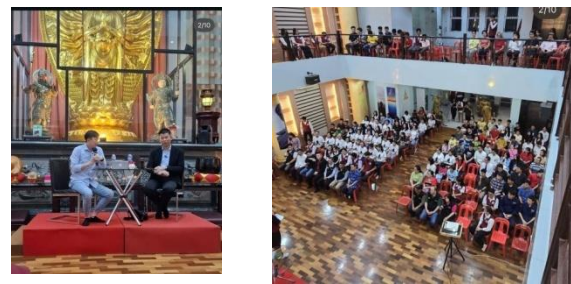
Gambar 3. Dialog dan Diskusi

Selama program berlangsung, fasilitator mengorganisir kegiatan interaktif seperti dialog antar agama dan diskusi kelompok mengenai pengalaman hidup berdampingan antaragama (Gambar 3). Setiap sesi dilaksanakan dengan prinsip inklusivitas, di mana setiap peserta diberi kesempatan untuk berbicara dan saling mendengarkan pandangan satu sama lain. Selain itu, kegiatan berbasis pengalaman, seperti simulasi atau role-playing, juga diterapkan untuk mengasah kemampuan peserta dalam menghadapi perbedaan keyakinan secara positif.