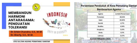
Gambar 2. Materi Edukasi

Kegiatan pengabdian dilakukan dengan tahapan persiapan, pelaksanaan dan evaluasi. Tahapan persiapan dimulai dengan identifikasi komunitas sasaran yang akan dilibatkan dalam program penguatan toleransi beragama. Langkah pertama adalah melakukan pemetaan sosial untuk memahami karakteristik, kebutuhan, serta tantangan yang dihadapi oleh komunitas terkait dengan isu toleransi antaragama. Dalam tahap ini, tim pengabdian melakukan komunikasi dengan tokoh agama, pemimpin masyarakat, dan perwakilan komunitas untuk memastikan dukungan terhadap program. Selain itu, program ini juga mempersiapkan materi-materi edukasi yang relevan tentang toleransi beragama (Gambar 2) dan alat evaluasi yang akan digunakan.