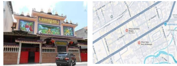
Gambar 1. Lokasi Pengabdian

Kegiatan pengabdian ini dihadiri oleh 184 orang anggota komunitas yang terdiri dari tokoh agama, pemuda, akademisi dan masyarakat. Kegiatan ini dilaksanakan di Vihara Samiddha Bhagya, yang beralamat di Jalan Thamrin, No. 97, Kel. Dwikora, Kec. Siantar Barat, Kota Pematangsiantar, Sumatera Utara 21146 (Gambar 1), pada hari Sabtu, 30 November 2024.