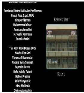
SCENE 11: End Scene