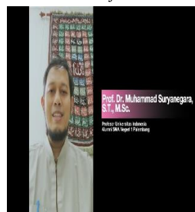
SCENE 9: Testimoni Alumni