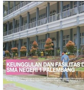
SCENE 7: Keunggulan dan Fasilitas Pembelajaran