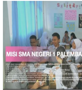
SCENE 2: Sejarah dan Visi Misi Sekolah