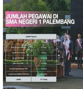
SCENE 3: Jumlah tenaga pendidik dan tenaga kependidikan