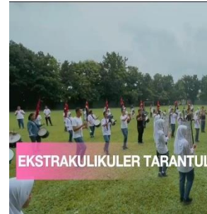
SCENE 6: Kegiatan Ekstrakurikuler