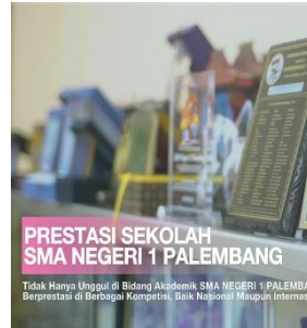
SCENE 5: Prestasi Sekolah