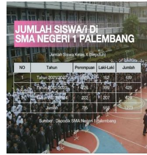
SCENE 3: Jumlah Peserta didik