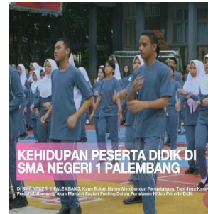
SCENE 8: Kehidupan Peserta didik di Sekolah