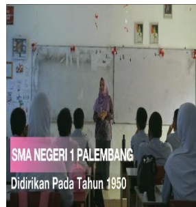
SCENE 2: Sejarah dan Visi Misi Sekolah