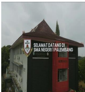
SCENE 1: Opening Scene : Memperkenalkan Sekolah

Storyboard adalah alat visual yang digunakan untuk merencanakan dan memetakan urutan adegan dalam produksi video, film, atau animasi. Biasanya berupa serangkaian gambar atau sketsa yang menggambarkan setiap adegan atau bagian dari cerita, dilengkapi dengan deskripsi singkat mengenai aksi, dialog, dan elemen teknis lainnya seperti pencahayaan atau sudut kamera. Storyboard membantu tim produksi, termasuk sutradara, editor, dan kru lainnya, untuk memahami secara jelas alur cerita, bagaimana adegan akan dieksekusi, serta interaksi antara visual dan audio. Dengan adanya storyboard , proses pembuatan video atau film menjadi lebih terstruktur dan efisien, karena semua orang dapat memiliki gambaran yang sama tentang apa yang akan terjadi dan bagaimana setiap bagian saling terkait. (Soenyoto, 2017)