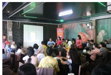
Gambar 2. Memberikan Materi Tentang NIB dan Sertifikat Halal