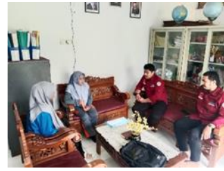
Gambar 1. Wawancara Bersama Guru

Tahapan pendekatan dan diagnosa tahapan ini dilakukan untuk mengetahui atau mengidentifikasi pengetahuan tentang pelecehan seksual pada anak disabilitas khususnya anak tunarungu. Tim melakukan wawancara pada tenaga pendidik dan anak disabilitas khusus anak tunarungu terkait permasalahan pelecehan seksual. "Kekerasan seksual masih sering terjadi pada anak pada saat proses bermain di halaman sekolah, kekerasan yang sering terjadi yaitu siswa menyentuh bagian belakang siswa lain dan masih banyak lagi" Ungkap guru yang mengajar.