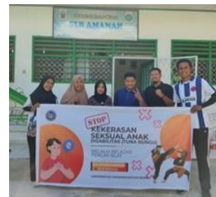
Gambar 6 . Foto Bersama dengan Kepala Sekolah dan Guru

3) Mempercayakan salah satu guru untuk menjadi pelatih bela diri pencak silat dengan menggunakan gerakan-gerakan sesuai dengan buku yang telah dibuat. Peran mitra dalam kegiatan, mulai awal kegiatan sampai akhir kegiatan yang dilakukan selama delapan bulan adalah menjadi salah satu fasilitator dalam melaksanakan pendampingan, mitra juga bekerja sama dalam memantau kegiatan dan perkembangan siswa dari hasil pelatihan.