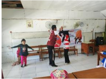
Gambar 3. Pelatihan Bela Diri

Setelah melakukan seminar atau setelah memberikan pemahaman tentang kekerasan seksual, maka tim pengabdian melakukan pelatihan bela diri pencak silat sebanyak empat pertemuan dan menggunakan gerakan yang sesuai dengan umur mereka (Iswana, 2013).