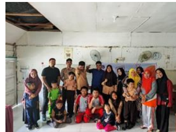
Gambar 2. Pelatihan atau seminar

Setelah melakukan berbagai persiapan meliputi sarana, prasarana dan mendiagnosis permasalahan yang terjadi di SLB Amanah, diagnosa bertujuan untuk mengetahui permasalahan yang terjadi.