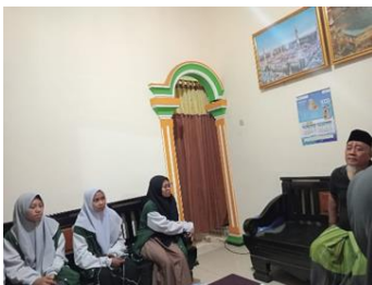
Gambar 2. Tahap Persiapan

Tak hanya itu, persiapan teknis juga menjadi perhatian utama, Tim memastikan semua peralatan yang dibutuhkan untuk kelancaran acara telah siap, termasuk sistem suara yang jelas dan optimal, pembuatan banner untuk mempermudah audiens mengenai tema yang diangkat serta layar proyektor untuk presentasi yang akan digunakan untuk selama penyuluhan dan sosialisasi. Semua elemen ini disusun dengan teliti untuk memastikan bahwa pesan yang disampaikan dapat diterima dengan baik oleh audiens dan tujuan dari kegiatan pengabdian masyarakat ini tercapai secara maksimal. Persiapan yang matang pada tahap ini diharapkan dapat mendukung keberhasilan pada tahap-tahap selanjutnya dalam program pengabdian masyarakat ini.