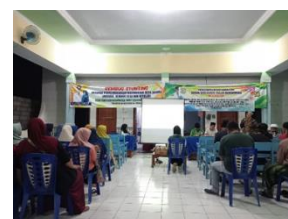
Gambar 3. Tahap Pelaksanaan