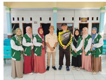
Gambar 4. Tahap Evaluasi

Berdasarkan tabel 5 aspek ketaatan masyarakat desa Panji Lor Situbondo mengalami peningkatan setelah diadakannya penyuluhan tentang kewajiban Pajak Bumi dan Bangunan, dimana yang pada awalnya sebesar 12.66% meningkat menjadi 56.46%. Hal ini dikarenakan semakin meningkatnya pemahaman masyarakat Desa Panji Lor Situbondo terhadap wajib Pajak Bumi dan Bangunan, sehingga meningkat pula kesadaran masyarakat yang kemudian berdampak pada ketaatan masyarakat untuk membayar Pajak Bumi dan Bangunan.