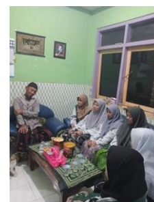
Gambar 1. Tahap Observasi