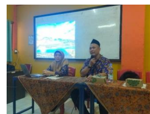
Gambar 1. Melakukan Sosialisasi dan Pelatihan di SMK Agra 2

Metode ceramah digunakan untuk menjelaskan teori-teori dasar dan pengetahuan umum tentang penelitian tindakan kelas (PTK) atau action research dan kiat-kiat penulisan yang tepat sehingga dapat mempublikasikan jurnal di artikel ilmiah baik yang umum ataupun jurnal ilmiah pendidikan metode ini diberikan pada tiap awal pembahasan pokok bahasan, yang bertujuan untuk memberikan dasar-dasar teori tiap pokok bahasan baru. Dasar teori ini yang dipergunakan untuk ceramah diperkuat dari hasil penelitian yang sebelumnya dalam bentuk jurnal baik itu yang terakreditasi maupun akreditasi nasional sehingga dapat menyeimbangkan antara teori dengan permasalahan yang baru dalam kegiatan proses belajar mengajar.