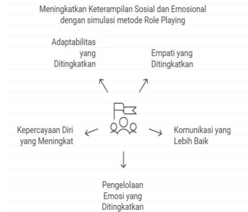
Gambar 1. Aspek Keterampilan Sosial dan Emosional yang Ditingkatkan melalui Simulasi Metode Role Playing

Gambar ini menggambarkan berbagai aspek keterampilan sosial dan emosional yang ditingkatkan melalui pelatihan berbasis simulasi metode role-playing . Pendekatan ini dirancang untuk memberikan pengalaman belajar interaktif kepada siswa, yang secara langsung mengasah kemampuan mereka dalam berbagai dimensi keterampilan sosial dan emosional. Lima aspek utama yang ditingkatkan adalah sebagai berikut: