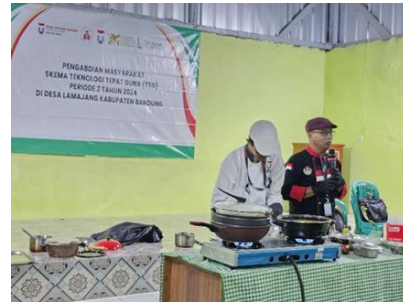
Gambar 4. Demo Masak MPASI Upaya Penanganan Stunting di Desa Lamajang