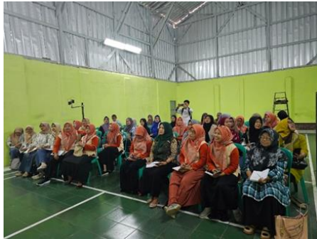
Gambar 5. Peserta Pelatihan Upaya Penanganan Stunting di Desa Lamajang

yaitu kompasiana dan video summary kegiatan pengabdian masyarakat dipublikasikan di Youtube Program Studi D3 Manajemen Pemasaran, Fakultas Ilmu Terapan.