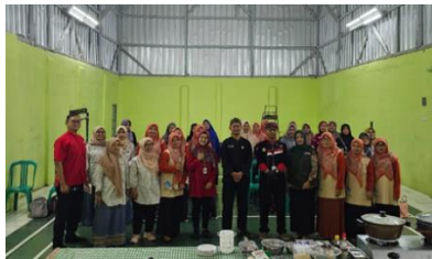
Gambar 2. Workshop dan Pelatihan Pengolahan dan Pemasaran Produk Pangan Lokal dalam Upaya Penanganan Stunting

Peserta workshop dan pelatihan sangat antusias dalam mengikuti rangkaian kegiatan ditandai dengan banyaknya peserta dan peserta aktif bertanya dan berdiskusi selama sesi workshop dan pelatihan berlangsung.