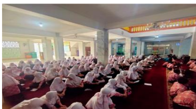
Gambar 1. Siswa/i sedang mengikuti kegiatan

Materi literasi keuangan disampaikan dengan nuansa dongeng ( storytelling ) menggunakan karangan dari Steeve Simbert yang berjudul The Three Little Pigs & Financial Planning . Cerita ini mengilustrasikan tiga bersaudara yang membangun rumah dengan perencanaan yang berbeda. Hasil dari setiap perencanaan rumah tersebut akan memberikan dampak yang berbeda bagi pemiliknya, baik dari tingkat keamanan dan kenyamanan yang didapatkan. Begitu pula dengan keuangan, perencanaan keuangan yang baik akan menghasilkan outcome yang baik juga. Inti yang disampaikan pada materi ini adalah apabila seseorang ingin sukses dan kaya, tidak cukup hanya dengan usaha keras, namun juga perlu memiliki perencanaan keuangan yang baik dengan memahami cara menabung yang benar dan melakukan investasi yang tepat dan aman.