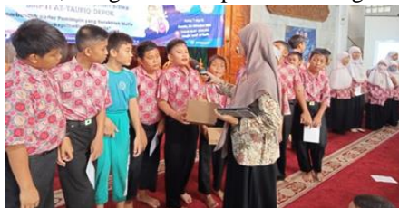
Gambar 2. Sesi Tanya Jawab Siswa/i

Berdasarkan hasil observasi menunjukkan bahwa 40 % siswa/i memahami literasi keuangan melalui cerita dan 60 % siswa/i memahami literasi keuangan melalui contoh atau praktek, Faktor yang memengaruhi siswa/i lebih cenderung menyukai melalui contoh atau praktek didasari oleh karakter anak-anak yang lebih menyukai praktek ketimbang teori. Selain itu terdapat 35 % Siswa/i disiplin menggunakan uang dan 65 % Siswa/i tidak disiplin menggunakan uang, faktor ini dikarenakan literasi tentang keuangan untuk anak sekolah dasar sangat minim dan beberapa faktor seperti game online yang terkadang harus mengeluarkan uang. Hasil juga menunjukkan bahwa 20 % Siswa/i mampu membuat penganggaran keuangan dan 80 % Siswa/i tidak mampu membuat penganggaran. Hal ini didasari karena para siswa/i sekolah dasar ini selain pemahaman literasi keuangan masih minim ada faktor lain seperti masih memudahkan meminta ke Orang Tua, ketimbang melakukan apa yang dibutuhkan, diinginkan ataupun menabung.