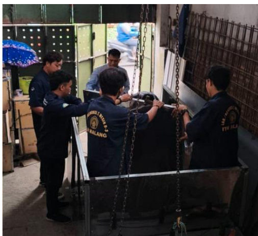
Gambar 3. Proses perakitan mesin pengering kopi

Setelah tahap persiapan selesai, Tim ITN Malang melanjutkan dengan pembuatan mesin pengering biji kopi sesuai dengan desain yang telah ditetapkan. Proses ini melibatkan dosen – dosen ahli dibidang teknik mesin, yang memberikan bimbingan dan supervise, serta mahasiswa yang terlibat dalam praktik pembuatan.