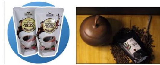
Gambar 4. Hasil Produk kopi

suatu proses pembelajaran diluar kampus, dengan tujuan mendekatkan mahasiswa kepada industri. Kerjasama ini tidak hanya memberikan pengalaman berharga bagi mahasiswa, tetapi juga memastikan bahwa mesin yang dihasilkan memenuhi standar teknis yang diperlukan.