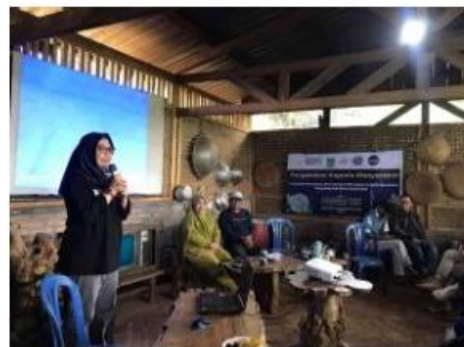
Gambar 1. Kegiatan Forum Group Discussion

Dalam rangka mencari solusi atas permasalahan yang dihadapi, Tim ITN Malang melakukan Focus Group Discussion (FGD). FGD ini bertujuan untuk mendapatkan pemahaman yang lebih mendalam mengenai permasalahan produksi biji kopi dan untuk mengemukakan ide – ide atau solusi yang relevan. Para peserta yang terdiri dari petani kopi, ahli teknologi, dan akademisi berbagai pandangan dan pengalaman mereka, sehingga dapat mengidentifikasi langkah – langkah konkret yang perlu diambil untuk meningkatkan kualitas dan kuantitas hasil kopi.