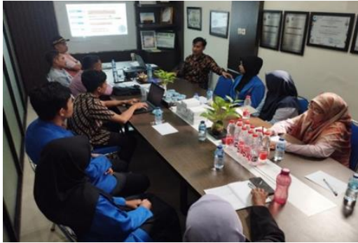
Gambar 3. Pemateri memberikan pelatihan pencegahan dan penanganan kasus bullying pada guru SD Muhammadiyah 1 Jember.