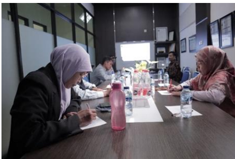
Gambar 2. Sejumlah guru SD Muhammadiyah 1 Jember mengerjakan Pre Tes

Kegiatan pelatihan anti bullying diawali dengan melakukan pre test terhadap sejumlah guru yang hadir. Pre test bertujuan untuk memetakan pemahaman guru terkait fenomena bullying di sekolah.