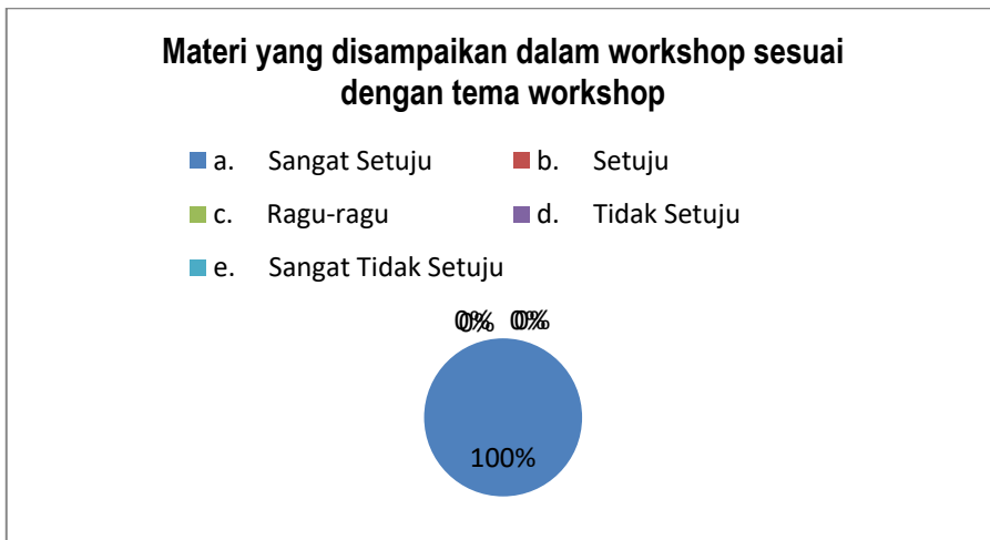
Gambar 1: Hasil angket kesesuaian materi dengan tema pelatihan

Berdasarkan angket yang disebar diperoleh data seperti diperlihatkan dalam diagram hasil pengisian google-form berikut ini: