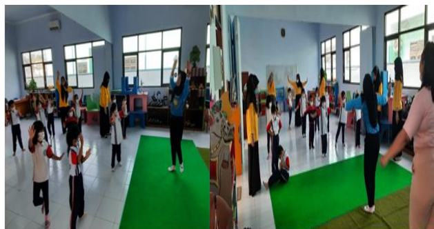
Gambar 4: Pelatihan Gerak Tari di PAUD Labschool UNp Kediri

Berikut dokumentasi kegiatan saat kegiatan PkM: