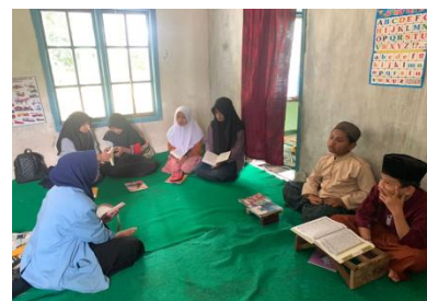
Gambar 1. Kegiatan Pendampingan Hafalan Juz 30 di DTA Tegal Heas

proses pembelajaran di taman pendidikan Al quran dusun Malangsari ini sangat membutuhkan suatu cara pembelajaran yang aktif dan aktratif. Berbagai aktifitas perlu diterapkan dalam kegiatan pembelajaran seperti bermain, menari, olahraga, gerakan tangan dan kaki dan apapun yang merupakan aktifitas positif. Yang dimaksud pembelajaran aktif adalah pembelajaran yang menekankan keaktifan pada anak didik untuk mengalami sendiri, untuk berlatih untuk berkegiatan, sehingga baik dengan daya pikir emosi dan ketrampilanya mereka belajar dan berlatih. Yang dimaksud dengan pembelajaran aktratif suatu proses pembelajaran mempesona, menarik, mengasyikan, menyenangkan, tidak membosankan, bervariasi, kreatif dan indah.