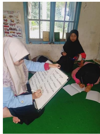
Gambar 5 : Pemberian Materi Dasar kepada para siswa

Selanjutnya Kegiatan belajar cara membaca Al-Qur'an (jilid), pembiasaan surat-surat pendek dan shalawat bersama. Meskipun, memiliki jenjang yang berbeda akan tetapi kegiatan pembelajaran ini tetap dilaksanakan dalam satu waktu dan satu tempat. Perbedaannya terletak pada kegiatan mengaji jilid. Anak-anak belajar membaca cara membaca Al-Quran (jilid) sesuai dengan pencapaian terakhir mereka saat disekolah. Ada juga yang memulai dari awal. Kemudian untuk pembiasaan surat-surat pendek dilaksanakan secara bersamaan mulai dari surat An-Nas hingga Al-Zalzalah. Selanjutnya, kegiatan terakhir yaitu bersholawat bersama dan membuat kaligrafi. Kegiatan membuat kaligrafi bersama ini dilaksanakan setiap hari kamis.