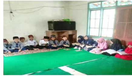
Gambar 2: Pemanfaatan Majelis sebagai tempat belajar

bermusyawarah dengan dengan masyarakat setempat untuk mencari calon tenaga pelajar. Proses pembelajaran akan tetap berjalan dengan menggunakan sarana dan prasarana yang ada.