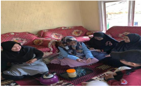
Gambar 3 : Pendekatan dan Musyawarah dengan Bu Ustadzah