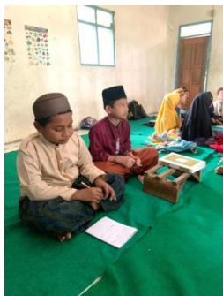
Gambar 4 : Pelatihan Cara Membaca dan Menulis Al-Qur'an

Sebagaimana peran dan pentingnya seorang pendidik, harusnya pendidik Madrasah Diniyah Takmiliah Awaliyah merasa bangga dengan profesi mulia ini karena berperan untuk menggoreskan tinta emas dalam pembentukan karakter dan keilmuan peserta didik agar mereka menjadi generasi masa depan yang berkualitas tinggi yang mampu membawa kemajuan bangsa di berbagai segi kehidupan.