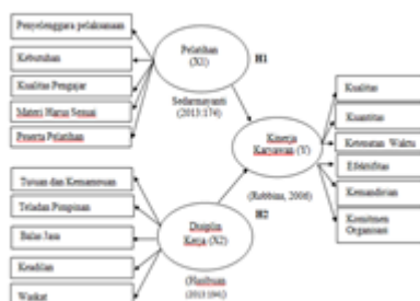
Gambar 1 Desain Penelitian

Metode penelitian yang digunakan dalam penelitian ini adalah dengan pendekatan kuantitatif asosiatif yaitu dengan mendeskripsikan keadaan responden serta deskripsi variable penelitian dalam tabel frekuensi dan presentase dari hasil penyebaran angket dengan melalui prosedur analisis data yaitu penelitian lapangan (observasi, wawancara, kuesioner).