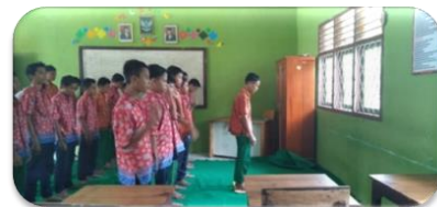
Gambar 2. Shalat Zuhur Berjamaah

Observasi yang dilakukan mengenai metode yang digunakan guru dalam mencapai tujuan pembelajaran salah satunya yaitu metode demonstrasi. Metode ini gunakan agar siswa lebih mengerti dengan apa yang disampaikan oleh guru sehingga dapat di praktikkan langsung serta siswa dapat menerapkannya ke kehidupan sehari-hari. Seperti dalam mata pelajaran Fiqih Ibadah para siswa melakukan Shalat zuhur berjamaah disekolah. Karena sarana untuk beribadah belum disediakan mereka memanfaatkan ruangan lokal untuk dijadikan sebagai tempat Shalat.