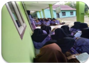
Gambar 3. Jum'at Bersih Membaca Yasin Bersama

Hasil observasi menunjukkan bahwa kendala yang dihadapi guru dalam proses belajar mengajar adalah kurangnya sumber belajar yang bisa menghambat pemahaman siswa. Kurangnya sarana dan prasarana yang dibutuhkan, seperti sarana untuk praktik dalam pembelajaran Fiqh Ibadah yang mengharuskan siswa untuk menerapkan teori yang dipelajarinya agar tercapai tujuan dari indikator pembelajaran tersebut.