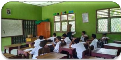
Gambar 1. Aktivitas Pembelajaran Kelas VII

Dari hasil observasi sumber daya teknologi yang terdapat di Madrasah Tsanawiyah Swasta Darul Hikmah kurang memadai, dikarenakan keterbatasannya media yang digunakan dalam proses pembelajaran. Sehingga guru hanya memanfaatkan media yang ada pada saat proses pembelajaran. Keterbatasan media dalam mengajar membuat guru lebih berpikir untuk bagaimana mengelola proses pembelajaran dengan menggunakan media yang tepat sehingga dalam proses pembelajaran tidak membuat siswa bosan dan supaya dapat mencapai tujuan pembelajaran yang telah ditetapkan.