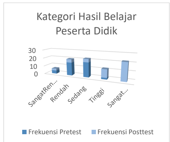
Gambar 2 Diagram Kategori dan Presentase Hasil Belajar Peserta Didik Pada Pretest dan Posttest

Berikut merupakan data frekuensi hasil pretest dan posttest yang disajikan dalam bentuk diagram batang: