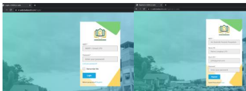
Gambar 4: Tampilan Menu Register E-SADA

Selanjutnya akan diarahkan pada laman berikut ini, dan lembaga dayah memilih salah satu menu, Login bagi yang sudah memiliki akun dan klik Register bagi belum ada akun. Setelah login lakukan registrasi dengan memasukkan data, kemudian lanjut klik Register dan Login kembali dengan data anda (data dayah).