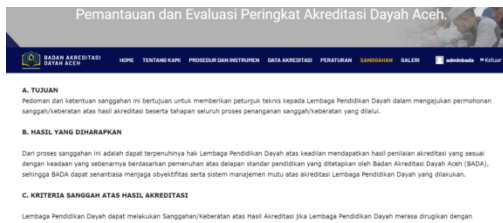
Gambar 6: Tampilan Menu Sanggahan Tipologi dayah

Pada masa tunggu 10 hari tersebut juga diberi kesempatan bagi lembaga dayah untuk mengoreksi dan memperbaiki redaksi penulisan nama dayah, mungkin ada kekeliruan dalam penulisan nama lembaga, nama pimpinan, sebutan, titel, alamat dan lain sebagainya. Mekanisme sanggahan peringkat dilakukan via online di situs website BADA, dengan cara membuka laman website www.badaaceh.com lalu klik sanggahan pada menu bar utama, baca secara seksama kriteria sanggahan atas hasil akreditasi dan ketentuan sanggahan di laman website . Berikut gambar menu website sanggahan: