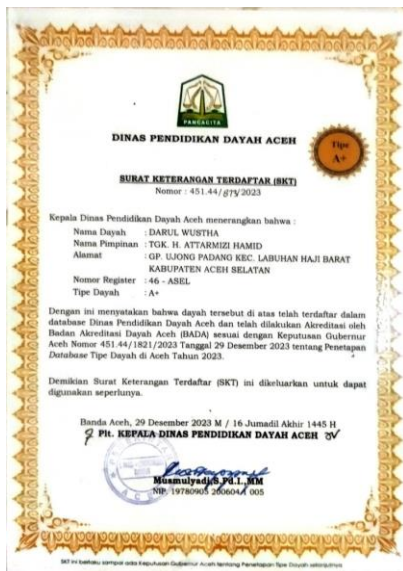
Gambar 8: Tampilan Sertifikat/ Piagam Akreditasi