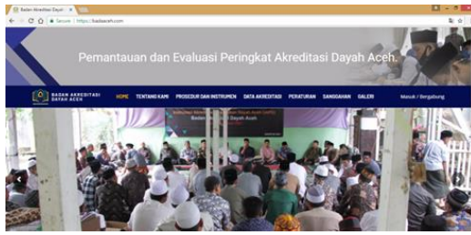
Gambar 2: Tampilan awal Website www.badaaceh.com

Selanjutnya Klik E-SADA (Elektronik Sistem Akreditasi Dayah Aceh), dengan laman berikut ini: