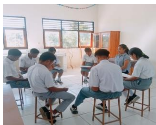
Gambar. Kegiatan pemberian Konseling Kelompok

Setelah subjek penelitian diidentifikasi, peneliti memberikan perlakuan kepada 7 siswa kelas XI A yang terpilih. Perlakuan yang diberikan berupa penerapan teknik biblioterapi melalui konseling kelompok, dengan mengikuti langkah-langkah terstruktur dari proses konseling kelompok. Intervensi ini dilakukan selama empat sesi.