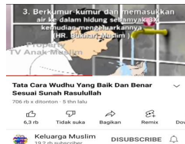
Gambar 3. Penyampaian Materi Thaharah Oleh Tim Pengabdian dari Youtube

Melakukan penyuluhan dan pelatihan dengan metode ceramah dan diskusi atau tanya jawab tentang materi Ibadah Thaharah dan wudhu kepada siswa-siswi TPA Kp.Tegalheas. Dalam kegiatan penyuluhan dengan menggunakan metode demontrasi dengan mempraktikan secara langsung kepada Anak-anak di TPA Kp.Tegalheas dan menggunakan media youtube tata cara wudhu sesuai tuntunan Al Quran dan Hadist.