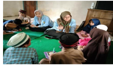
Gambar 2. Pemaparan materi dan tanya jawab tentang wudhu dengan siswa-siswi TPA di Kp.Tegalheas

Melakukan penyuluhan dan pelatihan dengan metode ceramah dan diskusi atau tanya jawab tentang materi Ibadah Thaharah dan wudhu kepada siswa-siswi TPA Kp.Tegalheas. Dalam kegiatan penyuluhan dengan menggunakan metode demontrasi dengan mempraktikan secara langsung kepada Anak-anak di TPA Kp.Tegalheas dan menggunakan media youtube tata cara wudhu sesuai tuntunan Al Quran dan Hadist.