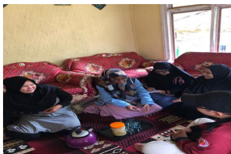
Gambar 1. Kegiatan Survei Tim Pengabdian di rumah ibu Ustadzah