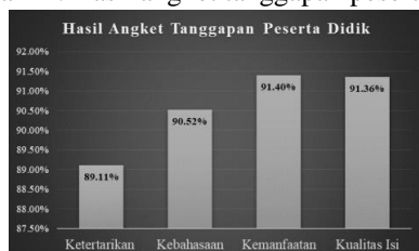
Diagram 1. Hasil angket tanggapan peserta didik

Dari diagram tersebut dapat dilihat bahwa indikator penilaian tertinggi adalah pada kemanfaatan LKPD dengan persentase sebesar 91,40%. Hal tersebut sejalan dengan tujuan utama pengembangan LKPD adalah sebagai bahan ajar tambahan yang nyata di kelas dan pada teori yang mengatakan bahwa pengembangan produk harus mampu menjawab pertanyaan; apakah produk mampu mengatasi masalah pembelajaran yang dihadapi? (Widodo, 2021). Seperti yang telah dikemukakan sebelumnya bahwa permasalahan utama di kelas adalah kurangnya bahan ajar sehingga proses pembelajaran hanya menggunakan buku paket saja. Dengan demikian dapat dikatakan bahwa adanya LKPD sebagai bahan ajar tambahan dapat mengatasi permasalahan di kelas.