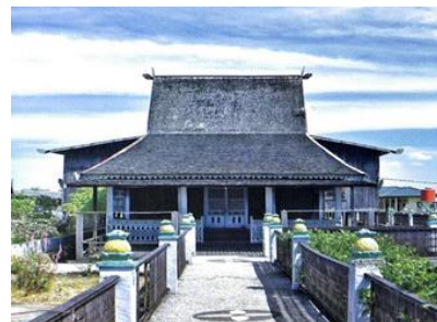
Gambar 1. Rumah Bubungan Tinggi

Dalam konteks ini, budaya Banjar yang kaya akan simbol-simbol geometris pada rumah adat, ornamen rumah adat, kain sasirangan, dan kerajinan tangan tradisional dapat dimanfaatkan untuk memperkenalkan konsep bangun datar secara lebih konkret dan bermakna. Contohnya budaya Banjar dapat menjadi referensi, seperti bangunan khas Banjar yaitu Masjid Suriansyah, Museum Wasaka, Rumah Bubungan Tinggi, dan Rumah Gajah Baliku. Bentuk-bentuk bangunan ini dapat dimanfaatkan sebagai bagian dari pembelajaran matematika karena mencerminkan unsur budaya yang relevan (Norhaliza dkk., 2022).