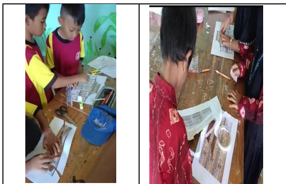
Gambar 1. Kerja kelompok erotimatika budaya banjar

Kegiatan proyek dilakukan dengan membagi siswa ke dalam kelompok-kelompok kecil, dengan masing-masing kelompok terdiri dari lima orang. Sebanyak empat kelompok berpartisipasi dalam kegiatan ini, di mana setiap kelompok dibekali dengan lembar kerja berbasis proyek (LKBP), gunting, dan lem. Selama proyek berlangsung, para siswa mengidentifikasi bangun datar yang terdapat pada struktur rumah Bubungan Tinggi. Lembar LKBP memberikan informasi sebagai panduan: bentuk segitiga dipasangkan dengan gambar ornamen Panapih, persegi, persegi panjang, dan belah ketupat dipasangkan dengan gambar ornamen Lalunggang, sedangkan trapesium, jajar genjang, dan lingkaran dipasangkan dengan gambar ornamen Jambangan.