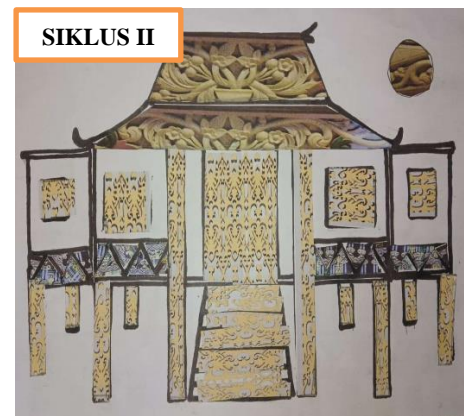
Gambar 4. Hasil Proyek Kreasi Poster Rumah Dinding bangun datar.

Hasil proyek yang dibuat siswa kelas 2 terdapat bentuk bangun datar trapesium pada bagian atap rumah Bumbungan Tinggi, dimana pada bentuk bangun datar ini ornamen yang digunakan adalah ornamen Jambangan . Hasil ini sudah sesuai dengan keterangan penggunaan ornamen Jambangan digunakan untuk bentuk bangun datar trapesium. Hal ini sesuai dengan penelitian yang dilakukan oleh Ruek & Padmasari (2022) menyatakan bahwa Atap rumah Bubungan Tinggi dalam konsep matematika merupakan bentuk bangun datar trapesium sama kaki.